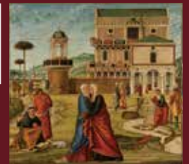
▶ ヴィットーレ・カルパッチョ 《聖母マリアのエリサベト訪問》 1504-08年 油彩/カンヴァス ヴェネツィア、ジョルジョ・フラン ケッティ美術館(カ・ドーロ)