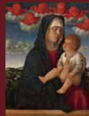
◀ ジョヴァンニ・ベッリニ 《聖母子(赤い智天使の聖母)》 1485-90年 油彩/板

会場：国立国際美術館 〒530-0005 大阪府大阪市北区中之島4-2-55 http://www.nmao.go.jp/