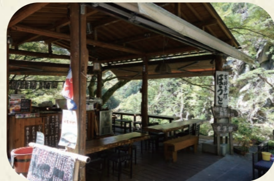
金溪館 山梨県甲府市高成町1026

山梨のご当地グルメといえば、ほうとう。ここでは、静かなせせらぎとともに美しい渓谷の景色を楽しみながらお食事をいただくことができます。ほうとうの他にも、御岳手打ちそば・岩魚塩焼き・甘味なども。昇仙峡の散策の途中に、ぜひ立ち寄ってみて。