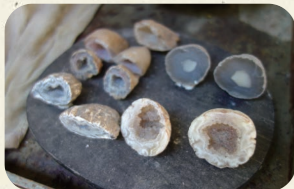
▲天然めの小割り体験: おひとり1,100円