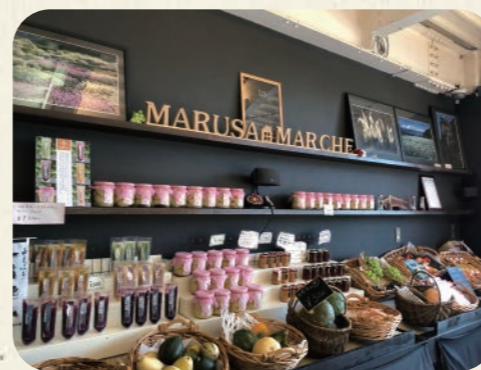
▲パフェ作り体験: 1,800円