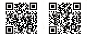
笛吹川温泉 別邸 坐忘 山梨県甲州市塩山三日市場2512

まず特筆すべきは、そのお料理。「茶料理 懐石まる喜」では、一汁三菜からはじまる茶料理を頂くことができます。普段、懐石の作法に触れる機会はないもの。作法に詳しくなくても優しく教えていただけるので、楽しみながら日本の文化に触れることができます。地元の食材を知り尽くした料理長のお料理は、最後のひと口までまさに絶品。離れのお部屋にひとたび足を踏み入れれば、まるで自宅のようなプライベート空間。お部屋の露天風呂もちろん素敵ですが、大浴場も捨てがたい。お風呂上がりには、開放的なライブラリーで心ゆくまで甲州ワインを楽しみましょう。慌ただしく過ぎる日常を忘れることができる、別邸 坐忘。なんとも心癒される時間が、あなたを待っています。