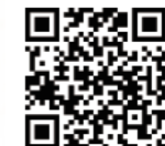
十勝川温泉第一ホテル 豊洲亭 北海道河東郡音更町十勝川温泉南12丁目

十勝川温泉のお湯は、世界的にも珍しい「モール温泉」。植物の間を通ってきた、「天然の化粧水」とも呼ばれる美肌の湯なんです。大浴場の庭園露天風呂では、滝の音を聴きながらゆったりできます。鉄板焼きのディナーでは、十勝の美味しい食材をじっくり堪能。そのあとはぜひ「足湯テラス はるにれ」で、十勝川を眺めながら食後酒を一杯どうぞ。ふと夜空を見上げれば、なんとも美しい星空が! 十勝の自然の恵みを、身体いっぱいに楽しめるホテルです。