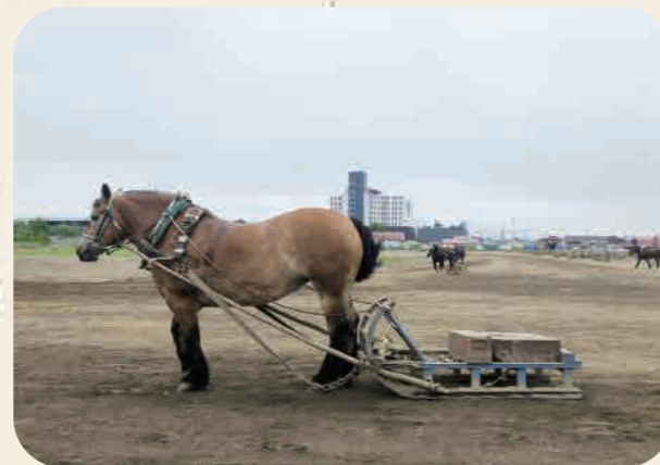
帯広競馬場 北海道帯広市西13条南9丁目

帯広でしか見ることのできない、「ばんえい競馬」。スピードではなくパワーを競うこの競馬は、「ばん馬」と呼ばれる逞しい馬たちが重りのついたそりを曳きます。ばん馬の体重は、サラブレッドの倍のおよそ1トン。北海道開拓時代、農耕馬同士で力比べをしていたのが起源なんだそう。レース観戦だけでなく、ばんえい競馬の裏側を覗けるバックヤードツアーにもぜひ参加してみてください。さらに美しいばん馬をじっくり見たいなら、なんといっても朝調教ツアーがおすすめ。調教師さんとばん馬の、朝の訓練の様子を見ることができます。力強いその姿に圧倒されることまちがいなし。