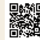
北の屋台 北海道帯広市西1条南10丁目7番地

帯広の街なかに突然現れる、趣のある小路。ここは、地元民にも愛される「北の屋台」です。典型的な居酒屋からジビエ、フレンチまで。様々なお店が集まって、活気のある雰囲気です。一軒一軒が小さめなので、とってもアットホーム。いろんな人とお喋りをしながら、北海道産の食材を使った郷土料理を存分に楽しむことができます。