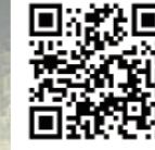
ウエスタンビレッジサホロ 北海道上川郡新得町狩勝高原